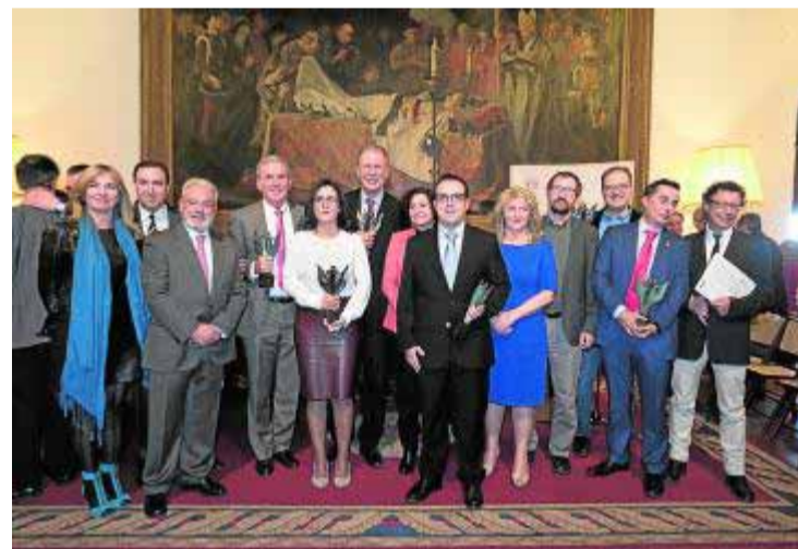
Premiados por el Consejo Social de la UGR.