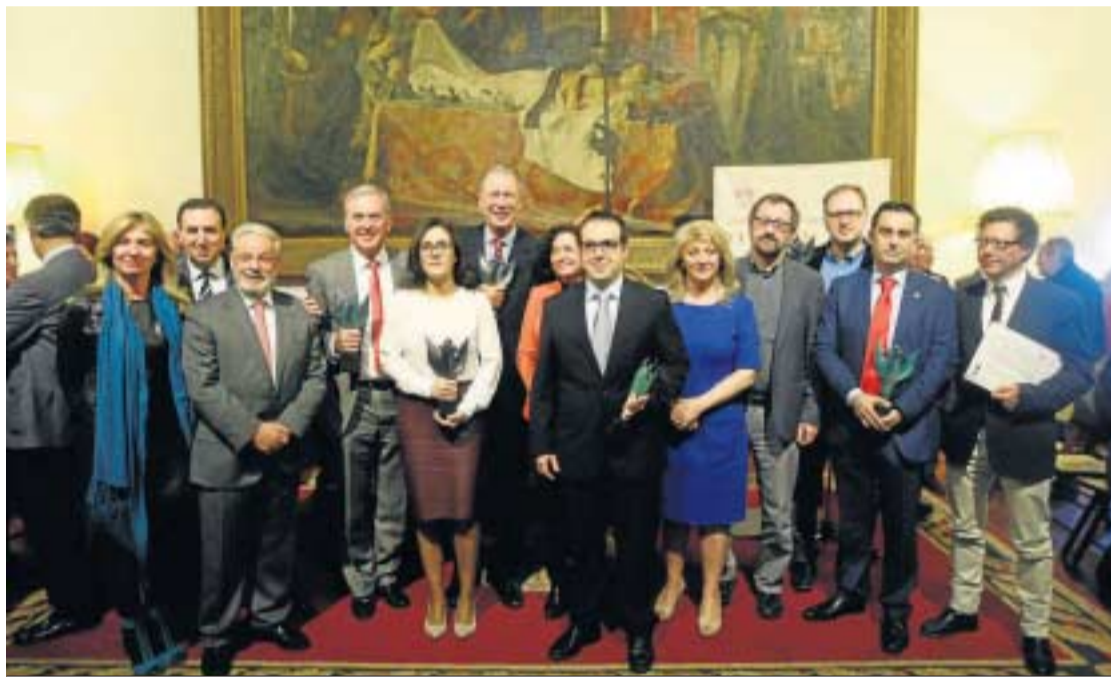
El presidente del Consejo Social y la rectora presidieron el acto de entrega de premios.