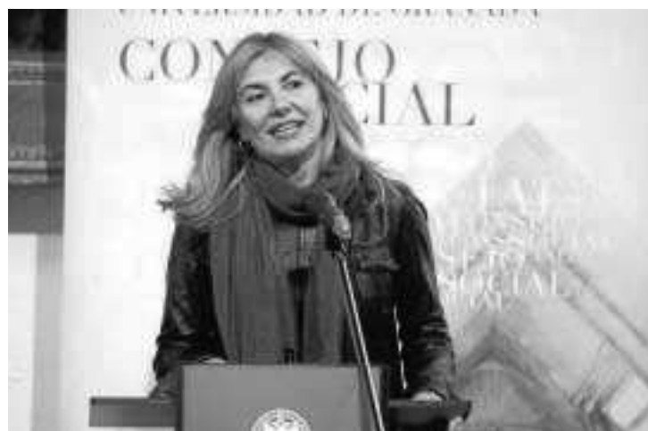
El Parque de las Ciencias fue distinguido por su labor social.

diar a los de otros países como Alemania, donde ella ha trabajado. “No to funciona mejor allí”, decía en su discurso la investigadora de la UGR, que lanzó un llamamiento a sus compañeros: “Tenemos que sobreponernos al