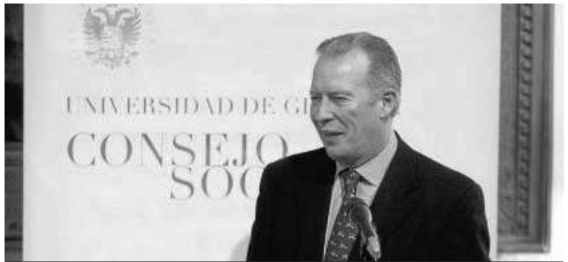
El premio para empresas colaboradoras en investigación fue para DestiNA Genomics.