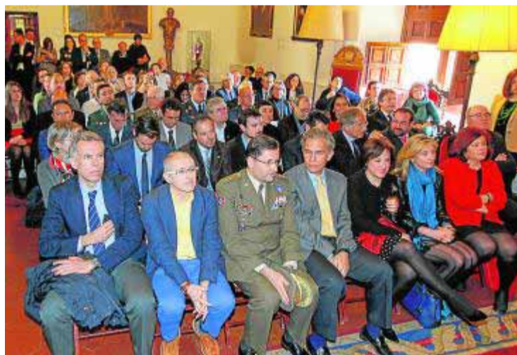
Aspecto del Salón de Rectores del Hospital Real.