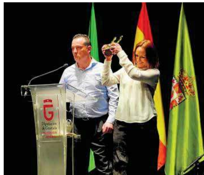
Miembros de una de las asociaciones premiadas.