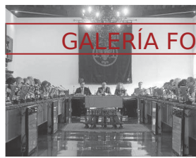
Consejo de gobierno del pasado lunes.