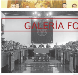
Consejo de gobierno del pasado lunes.

El acto tendrá lugar en la Gran Sala de la Universidad de Granada, el día 14 de mayo a las 10:00 horas. El acto será gratuito y abierto a todo el público interesado.