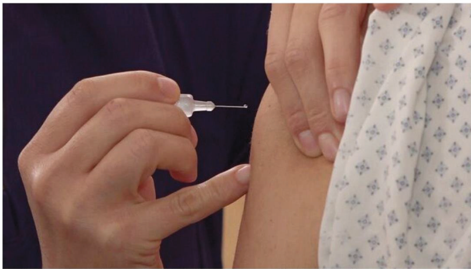
El presidente de Farmaindustria cuestiona en Granada que la liberalización de la patente de la vacuna del Covid-19 solucione los problemas de suministro / R. G.