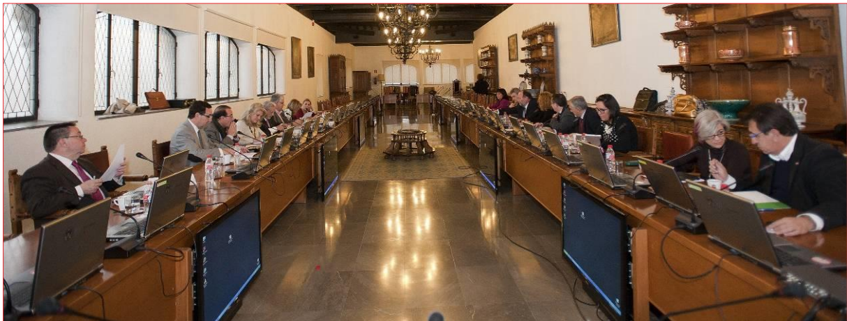
Pleno del Consejo Social de la Universidad de Granada Sala de Convalecientes – Hospital Real

El desarrollo de las diferentes sesiones se ha realizado con el detalle de los siguientes puntos del orden del día y adopción de acuerdos que se transcriben en el Anexo 1 -la documentación de referencia de estos asuntos se encuentra disponible en la Secretaría del Consejo Social-: