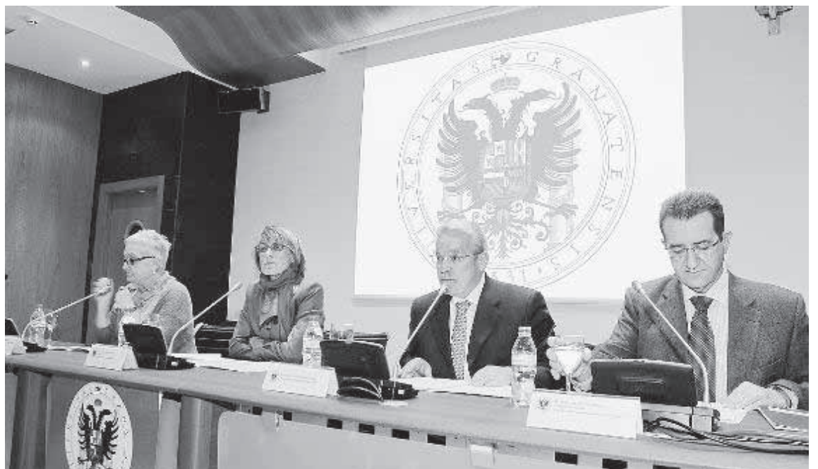
Mesa de apertura de la jornada de trabajo del Consejo Social.